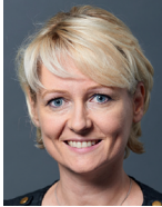
Isabelle Moret Nationalrätin, H+ Präsidentin / Conseillère nationale, Présidente de H+