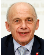
Ueli Maurer Bundesrat / Conseil fédéral Eidgenössisches Finanzde- partement EFD / Département fédéral des finances DFF