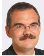
Jean-François Steiert Conseiller national Av. du Général-Guisan 12 1700 Fribourg