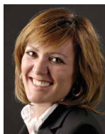
Maude Righi MRI COMMUNICATION Courberaye 34 2012 Avenier