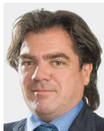
Antoine Hubert AEVIS Holding SA rue Georges-Jordil 4 1700 Fribourg