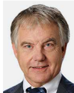
Conrad Engler H+ Die Spitäler der Schweiz, Bern / H+ Les Hôpitaux de Suisse, Berne